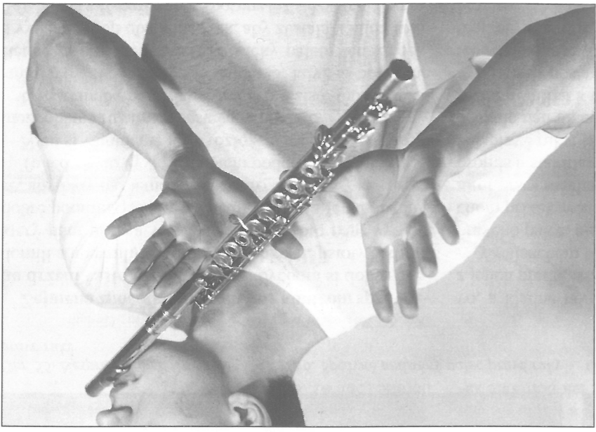
Obr. 50. Kontrola „mrtvé polohy“